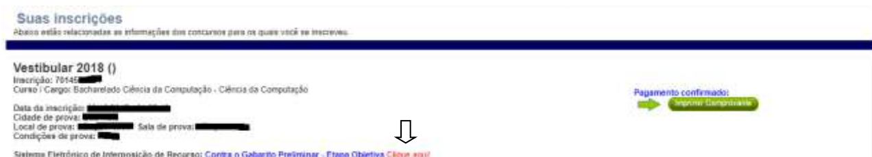
Figura 3 - Lista de Certames (Link de Acesso ao Sistema de Recursos)

Etapa 03 – Ao localizar o certame, verifique a disponibilidade do link: Sistema Eletrônico de Interposição de Recurso: Contra o Gabarito Preliminar - Etapa Objetiva Clique aqui! , conforme imagem abaixo: